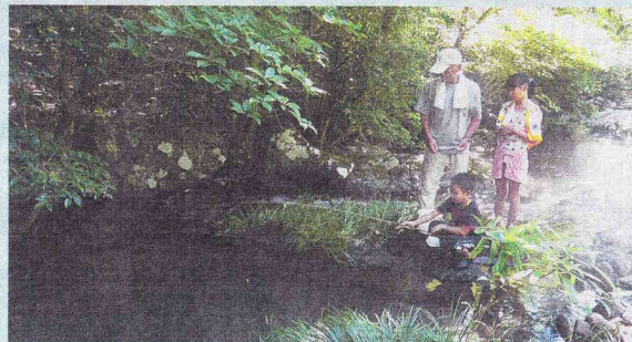
長崎県東彼杵郡川棚町川原

石木ダム事業は長崎県と佐世保市の共同事業で、その負担割合は県が65%(約185億円)で佐世保市が35%(約100億円)です。そして、県や市にはそれぞれ国からの補助金が交付されます。県には国土交通省から半分(92億5千万円)が、佐世保市には厚生労働省から3分の1(33億2千万円)が補助されます。つまり、石木ダムには日本国民の税金も126億円近く使われることになっています。国の抱える財政赤字は刻々と増え続け、国民一人当たりの借金額が1千万円を超えている今、税金の使い道は吟味する必要があります。また、関連水道施設の整備が必要で、その費用254億円の9割以上が佐世保市負担です。ダム建設費と合わせると、佐世保市負担の総額は298億円にもなりますが、この事実をほとんどの市民は知りません。そして、その財源内訳は一般会計出資金53億円、水道局負担金245億円となっています。水需要が減り続け、水道料金収入が減少する水道局。結果的に水道料金の値上げに繋がります。