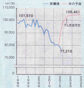
佐世保市水道の一日最大給水量の実績と市予測 (佐世保地区)