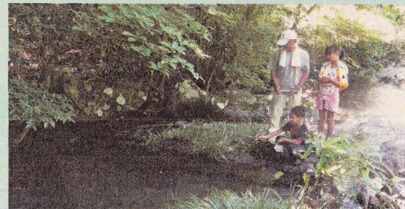
長崎県東彼杵郡川棚町川原

石木ダム事業は長崎県と佐世保市の共同事業で、その負担割合は県が65%(約185億円)で佐世保市が35%(約100億円)です。そして、県や市にはそれぞれ国からの補助金が交付されます。県には国土交通省から半分(92億5千万円)が、佐世保市には厚生労働省から3分の1(33億2千万円)が補助されます。つまり、石木ダムには日本国民の税金も126億円近く使われることになっています。国の抱える財政赤字は刻々と増え続け、国民一人当たりの借金額が1千万円を超えている今、税金の使い道は吟味する必要があります。また、関連水道施設の整備が必要で、その費用254億円の9割以上が佐世保市負担です。ダム建設費と合わせると、佐世保市負担の総額は298億円にものぼりますが、この事実をほとんどの市民は知りません。そして、その財源内訳は一般会計出資金53億円、水道局負担金245億円となっています。水需要が減り続け、水道料金収入が減少する水道局。結果的に水道料金の値上げに繋がります。