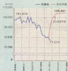
佐世保市水道の一日最大給水量の実績と市予測 (佐世保地区)