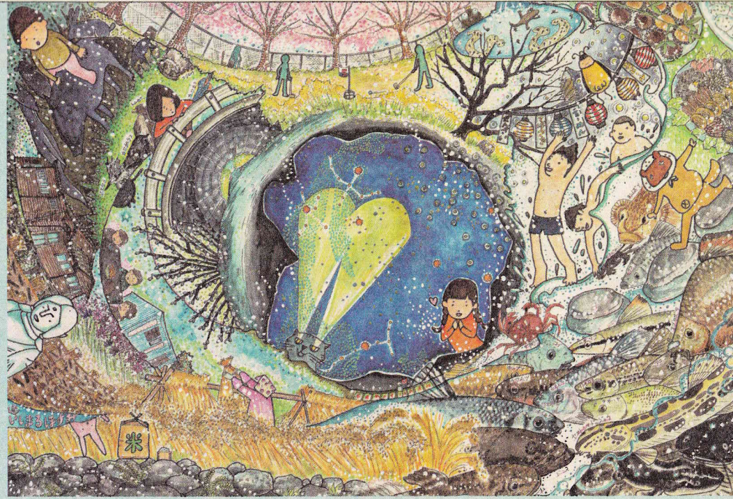
画/いしまるますみ