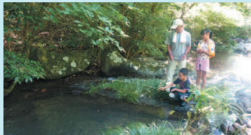
長崎県東彼杵郡川棚町川原

石木ダム事業は長崎県と佐世保市の共同事業で、その負担割合は県が65%(約185億円)で佐世保市が35%(約100億円)です。そして、県や市にはそれぞれ国からの補助金が交付されます。県には国土交通省から半分(92億5千万円)が、佐世保市には厚生労働省から3分の1(33億2千万円)が補助されます。つまり、石木ダムには日本国民の税金も126億円近く使われることになっています。国の抱える財政赤字は刻々と増え続け、国民一人当たりの借金額が1千万円を超えている今、税金の使い道は吟味する必要があります。また、関連水道施設の整備が必要で、その費用254億円の9割以上が佐世保市負担です。ダム建設費と合わせると、佐世保市負担の総額は298億円にもなりますが、この事実をほとんどの市民は知りません。そして、その財源内訳は一般会計出資金53億円、水道局負担金245億円となっています。水需要が減り続け、水道料金収入が減少する水道局。結果的に水道料金の値上げに繋がります。