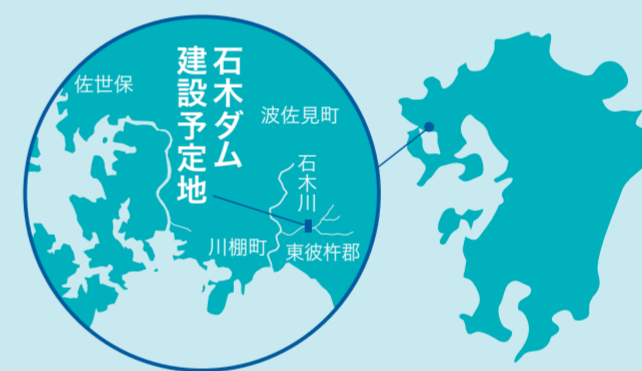
長崎県・川棚川支流石木川

ドデータブックの絶滅危惧Ⅰ類カワガラス、ヤマセミ、トノサマガエル、オナガサナエ、絶滅危惧Ⅱ類カスミサンショウウオ、ヤマトシマドジョウ、コムラサキ、クロサナエ、オジロサナエなど貴重な生き物が棲息する命あふれるスポットです。石木川は小さな川で、まるで唱歌『春の小川』そのままです。川原で生まれた子どもたちはここで魚を追いかけ、遊び、育ってきました。大人たちは石木川の清流で美味しい米や野菜を作り、元気な子どもを育ててきました。そして、今もここには赤ちゃんからお年寄りまで約60人が暮らしています。まるで1つの大家族のようです。今の日本がどこかに置き忘れてきた風景と人々の絆が残っている、まさに絶滅危惧集落かもしれません。